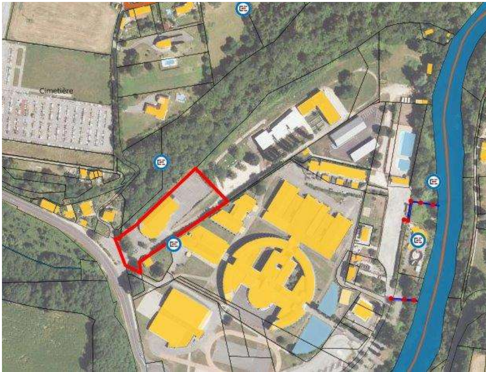
vue aérienne de la salle polyvalente