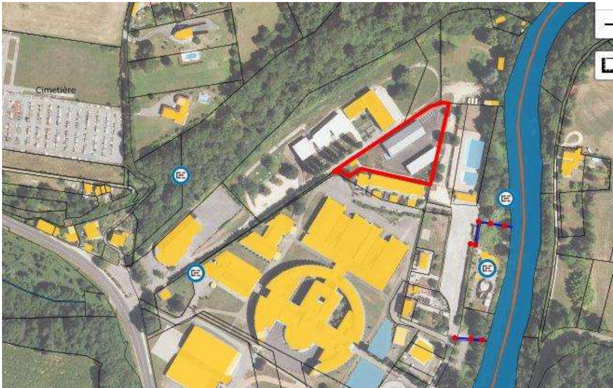
vue aérienne du CTM